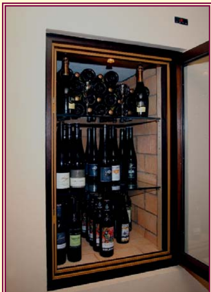
Fassung: 2 x ca. 150 Flaschen Wein